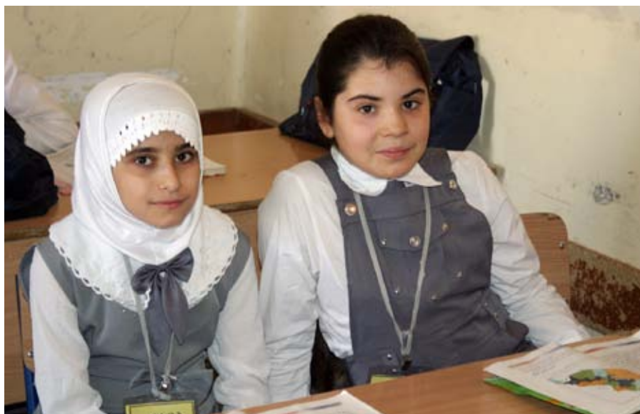
kulturskolen forener: Kulturskolene er åpne for alle. Muslimer og kristne hygger seg sammen etter skoletid.

– Senteret er åpent for alle, både kristne og muslimer. Senteret har tilbud innen fag som musikk, bildekunst og drama. Internett er helt nytt i Kurdistan, så vi