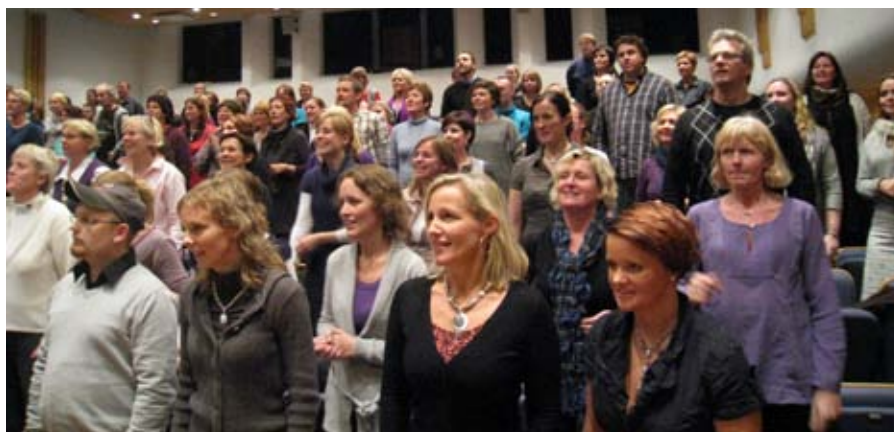
jubel og trøkk: stor sangiver da Kor Arti'-turneen gjestet Grieghallen i Bergen.