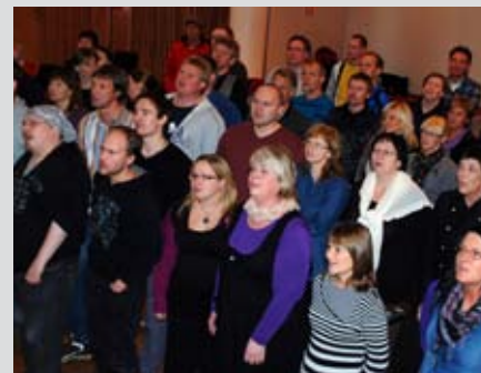
sammen og samstemt: Deltakerne synger Åge Aleksandersens "Rosalita".