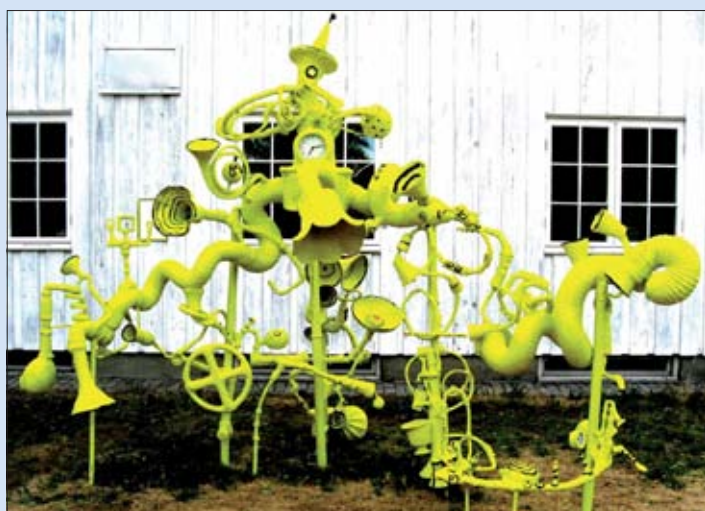
Kjellberg Kulturskole, Gruppenbild