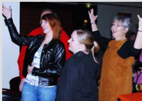
sosialt også: Stort engasjement på musikkvizen før festmiddagen.