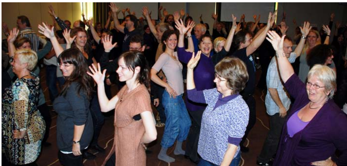
danset seg sammen: Sørrendingene fikk mer lagfølelse gjennom praktisk, svingende arbeid.